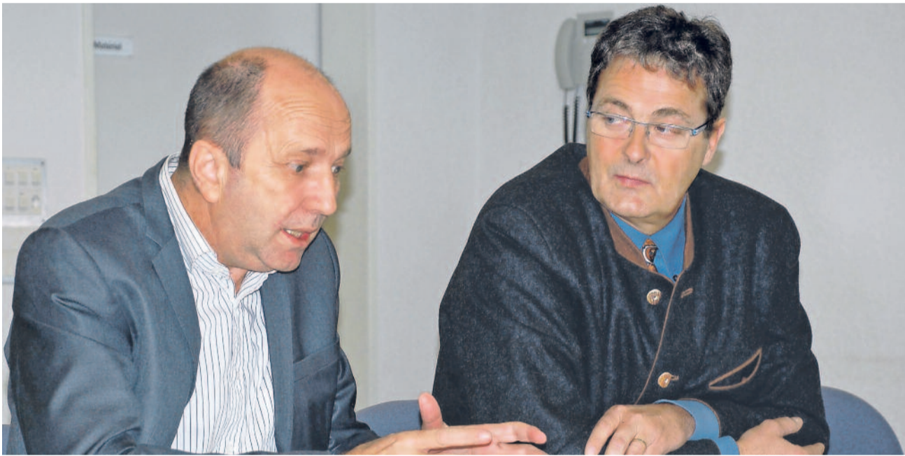
Gegner der Initiative. Nationalrat Jean-René Germanier (links) und Ständerat Jean-René Fournier kämpfen wie so viele bürgerliche Politiker gegen die SP-Steuerinitiative.

Die Initiative stelle einen Angriff auf die Autonomie der Kantone dar und schränke die Rechte der Bürger ein. Sollte der Spitzensteuersatz für Einkommen über 250 000 Franken schweizweit bei 22 Prozent festgelegt werden, so müssten auch die Steuersätze für tiefere Einkommen angehoben werden. Weil sprunghaft ansteigende Steuersätze verfassungswidrig seien, müsste die Steuerkurve graduell auf den Spitzensteuersatz von 22 Prozent angepasst werden. Dies hätte aber zur Folge, dass auch die Mittelschicht und die tieferen Einkommen mit höheren Steuern zu rechnen hätten, betonen die Gegner der Steuerinitiative. Zudem wird befürchtet, dass reiche Leute das Land verlassen. | Seite 3